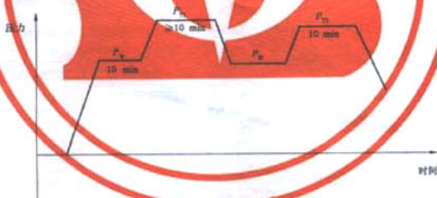
图2 在用压力容器的加压程序

在用压力容器的加压程序见图2。声发射检测在达到压力容器最高工作压力 P_w 的50%前开始进行,并至少在压力分别达到最高工作压力 P_w 和最高试验压力 P_{T1} 时进行保压。如果声发射数据指示可能有活性缺陷存在或不确定,应从最高工作压力 P_w 开始进行第二次加压检测,第二次加压检测的最高试验压力 P_{T2} 应不超过第一次加压的最高试验压力 P_{T1} ,建议 P_{T2} 为97% P_{T1} 。